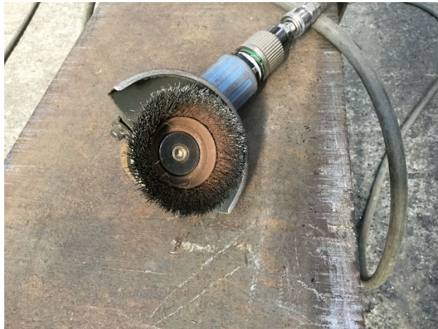
使用できるワイヤカップブラシの例(真鍮製) ※外観検査に支障がないことを確認できたもの